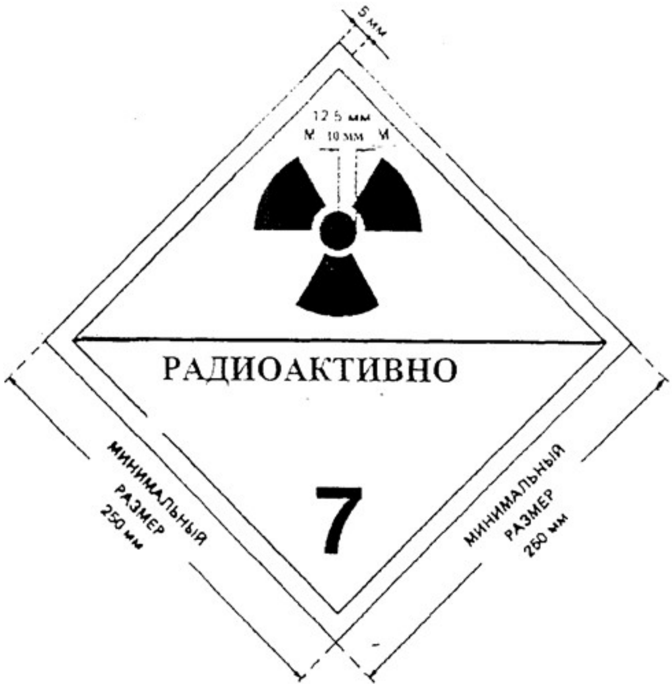
Рисунок 5. Предупредительный знак. Указаны минимальные размеры, при использовании больших размеров следует сохранять указанные пропорции. Высота цифры «7» не менее 25 мм. Цвет фона верхней половины знака - желтый, нижней половины - белый, цвет основного знака радиационной опасности (трилистника) и надписи - черный. Использование слова «РАДИОАКТИВНО» в нижней части необязательно, что позволяет применять этот знак для изображения соответствующего номера ООН для груза.