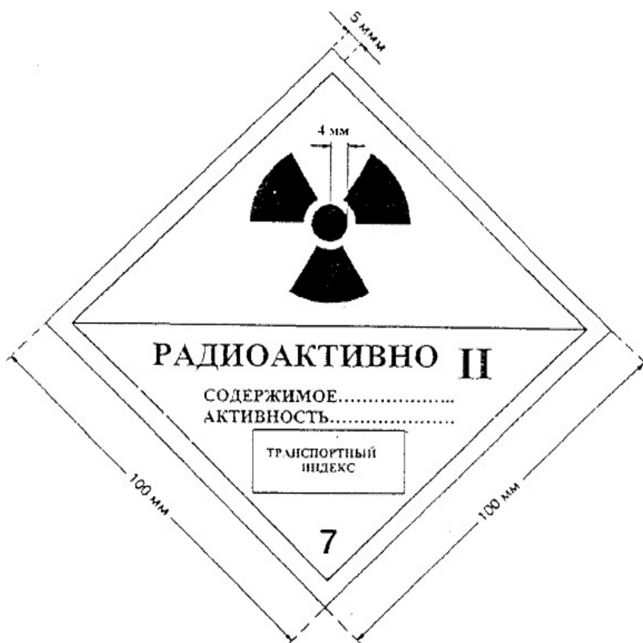
Рисунок 3. Этикетка категории «II-ЖЕЛТАЯ». Цвет фона верхней половины этикетки - желтый, нижней половины - белый, цвет основного знака радиационной опасности (трилистника) и надписей - черный, цвет полос, обозначающих категорию, - красный.