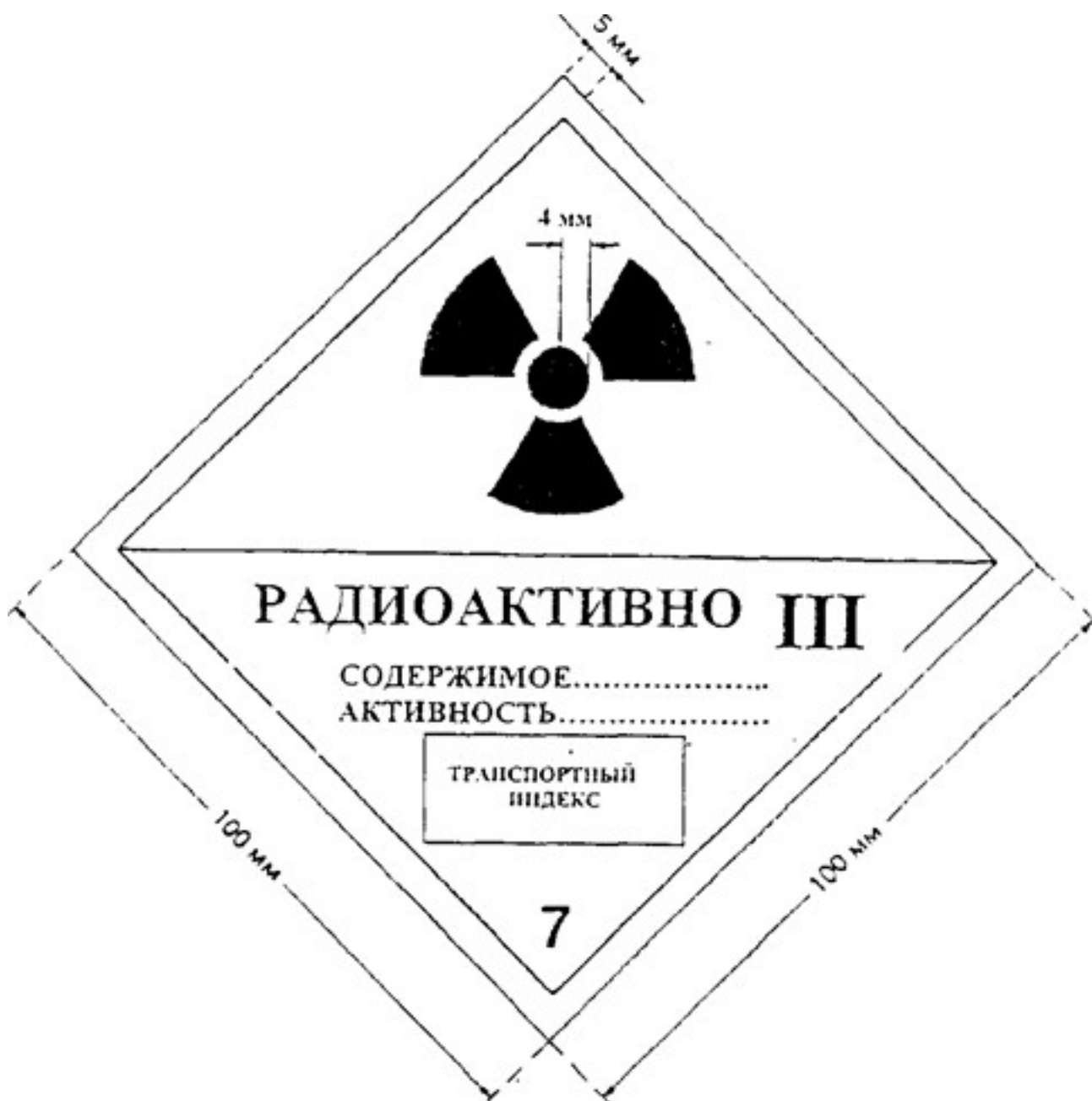
Рисунок 4. Этикетка категории «III-ЖЕЛТАЯ». Цвет фона верхней половины этикетки - желтый, нижней половины - белый, цвет основного знака радиационной опасности (трилистника) и надписей - черный, цвет полос, обозначающих категорию, - красный.