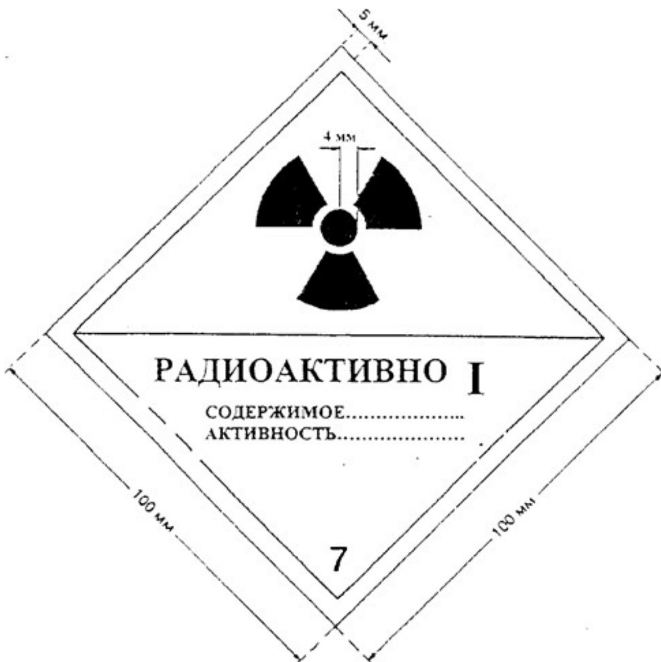
Рисунок 2. Этикетка категории «I-БЕЛАЯ». Цвет фона этикетки - белый, цвет основного знака радиационной опасности (трилистника) и надписей - черный, цвет полосы, обозначающей категорию, - красный.